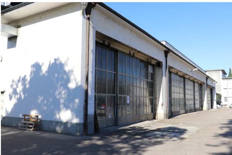
Aussenansicht Halle F «Kunst im Depot»

«Kunst im Depot» - der Ort, wo Kunst sich entwickelt – 2024